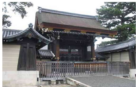
5 けんれいもん 建礼門

御所正面にある正門。堂々としたその姿は、帝王の門、または日本第一の門ともいわれています。開門されるのは天皇や国賓の来場など、特別な行事のみ。