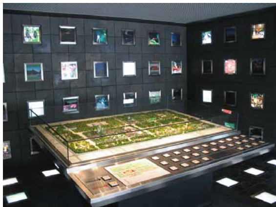
6 なかだちうりきゅうけいじょ てんじ 中立売休憩所・展示ホール

左右の築地塀には、5本の筋・水平の線が入っており、これが塀として最高の格式を示すものとされています。