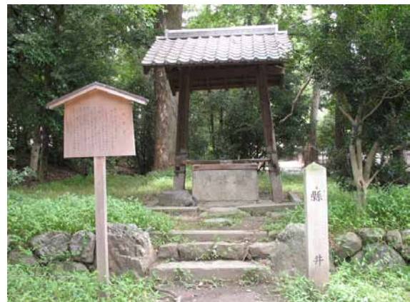
7 あがたい 県井