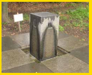
景井を偲ぶ井戸水。流れる水に手をつけてみましょう。ひととき“涼”を感じてみませんか？