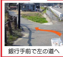
銀行手前で左の道へ