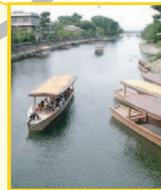
▲ 舟付き場 きせんばし 喜撰橋から望む舟付き場は、風情豊か。